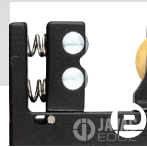
Patentiertes Smart Spring Design

JAV-1011 Ratschen Rohrabschneidersatz (Inbegriffen JAV-1010 rohrabschneider)